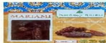
Kurma Mariami (400g)