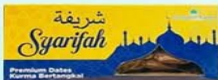
Kurma Tangkai (400g)

Harga jualan lebih murah berbanding harga di pasaran biasa. Diskaun 5% kepada pembelian 10 kotak dan ke atas.