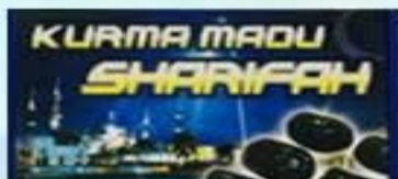
Kurma Madu (500g)