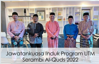
Jawatankuasa Induk Program UTM Serambi Al-Quds 2022

Lembaga Pengarah UTM telah bersetuju untuk melaksanakan Program UTM Serambi Al-Quds 2022. Dalam program ini, UTM akan menawarkan tempat dan biasiswa kepada 10 orang pelajar Palaestin untuk mengikuti pengajian program Ijazah Doktor falsafah, dalam pelbagai bidang dan fakulti di UTM, selama enam semester atau tiga tahun.